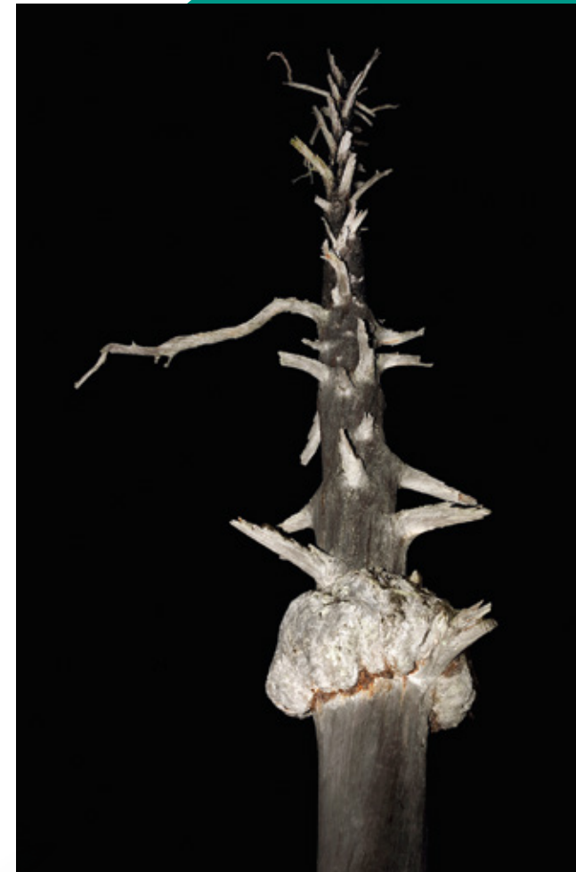
Esko Männikkö: Nimetön sarjasta UUPUU / Untitled from the Serie UUPUU, 2016