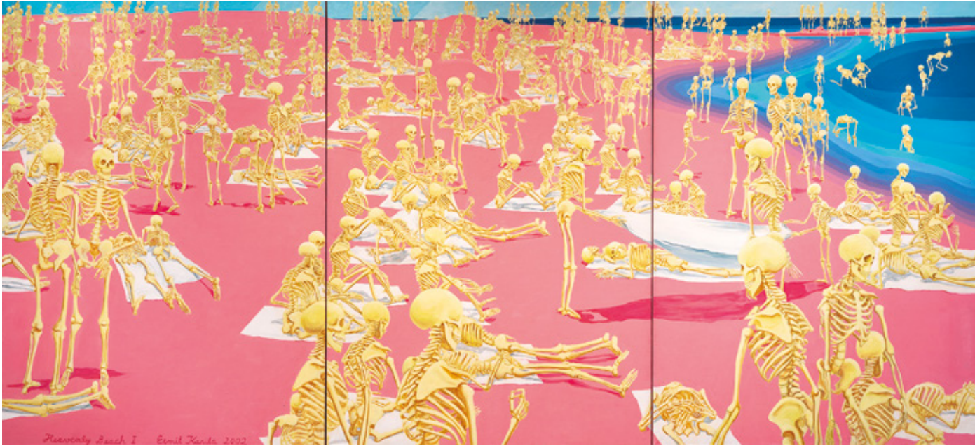
Emil Karila: Heavenly Beach 1, 2002