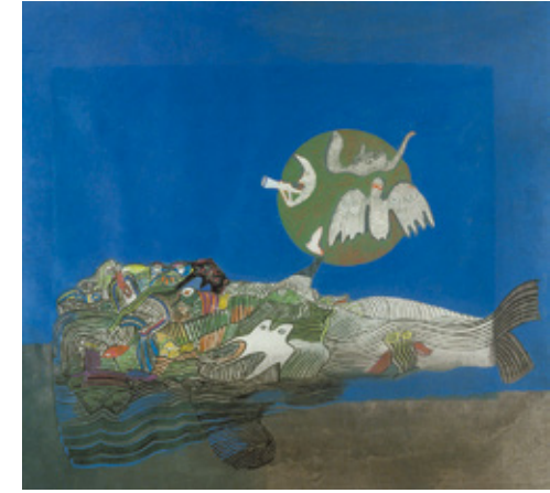
Antti Vuori: Veden kummajainen / Water Spirit, 1976

Eemil Karilan teosten aiheet määräävät yleensä niiden toteutustekniikan. Karilalle taide tarkoittaa oppimista. Taiteen tekeminen opettaa tekniikoiden ja itseilmaisun ohella myös laajemmin suhtautumista elämään ja elämiseen.