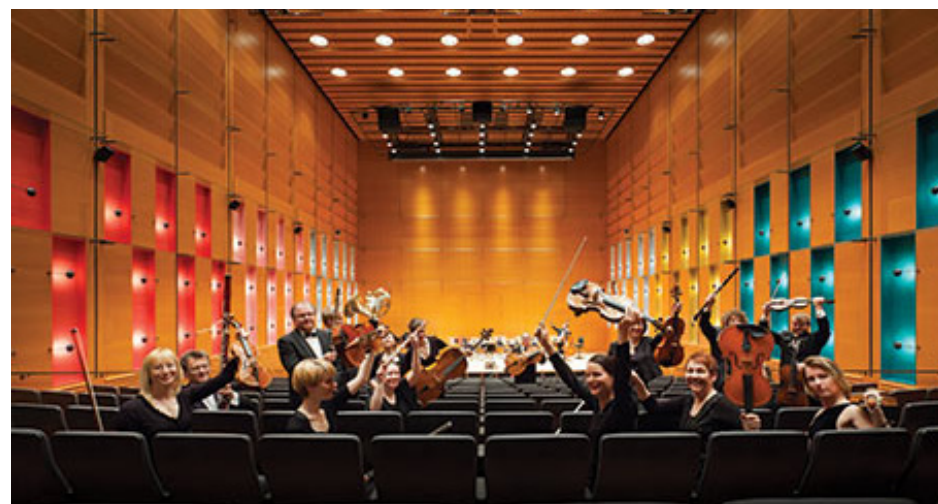
В культурном центре современный концертный зал. Камерный оркестр Лапландии.

В музее Корунди вы можете увидеть одну из самых ярких коллекций современного искусства в Финляндии. Здесь собрано около 3000 произведений финского искусства с 1940-х годов до наших дней. В музее проходят сменные выставки, посвященные разным сферам искусства.