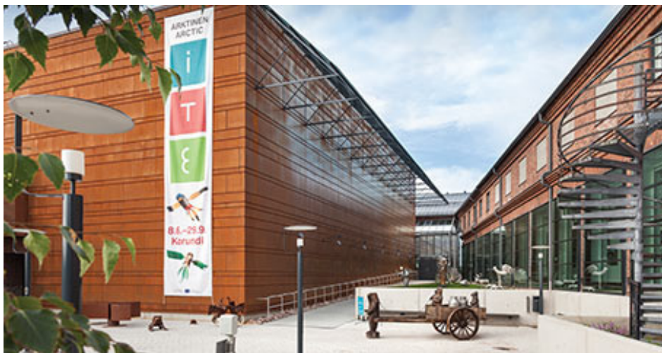
Здание музея - одно из самых старых сохранившихся в Рованиеми, построено в начале 1930-х годов.

Центр Культуры Корунди даёт возможность окунуться в мир искусства, музыки и других мероприятий. Основные функции Корунди вращаются вокруг двух международно-признанных творческих организаций: Камерного Оркестра Лапландии и Художественного Музея Рованиеми.